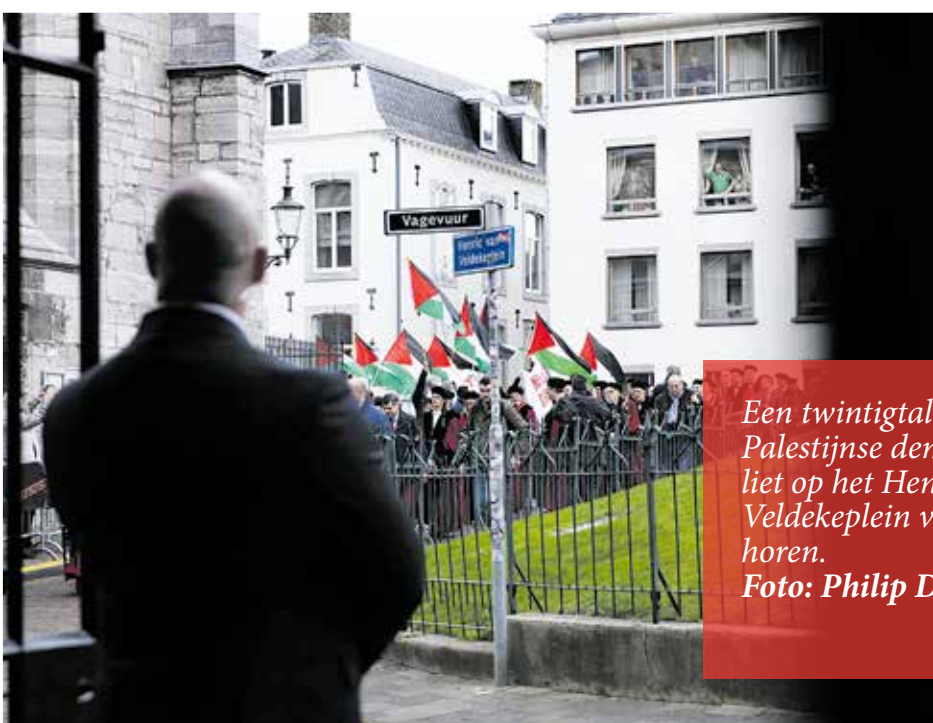
Een twintigtal pro-Palestijnse demonstranten liet op het Henric van Veldekeplein van zich horen.