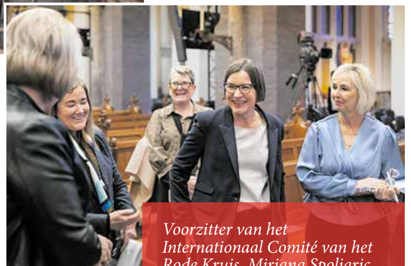
Voorzitter van het Internationaal Comité van het Rode Kruis, Mirjana Spoljaric Egger (midden), kreeg een van de drie eredoctoraten uitgereikt. Haar toespraak kreeg de aanwezigen stil.