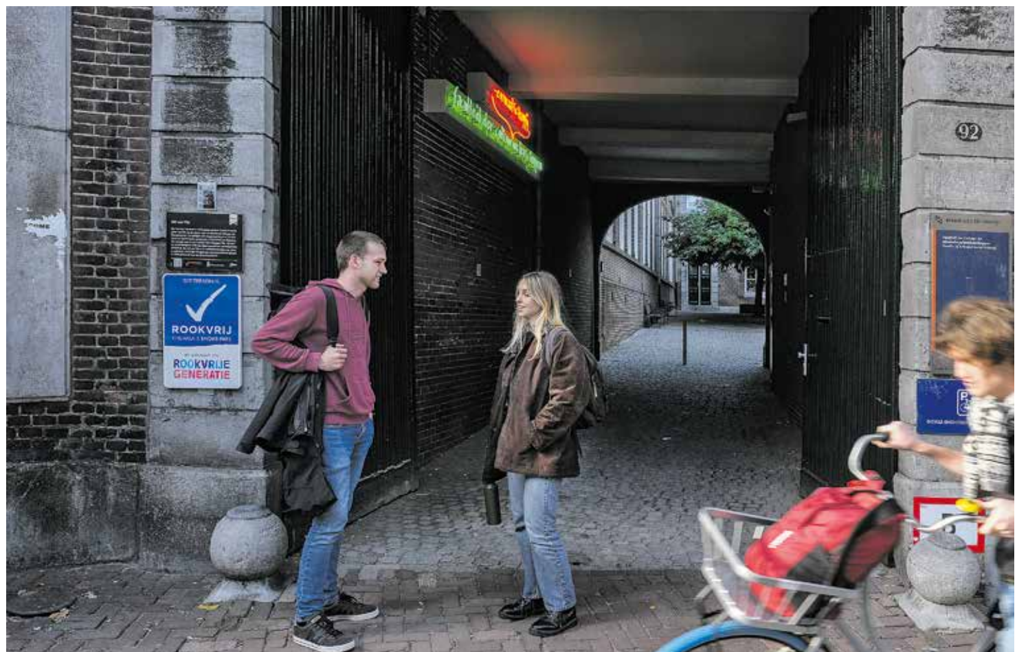
Studenten voor het FASoS-pand aan de Grote Gracht

Podcast 50 jaar UM: Hoe Sjeng Kremers de universiteit op de kaart zette