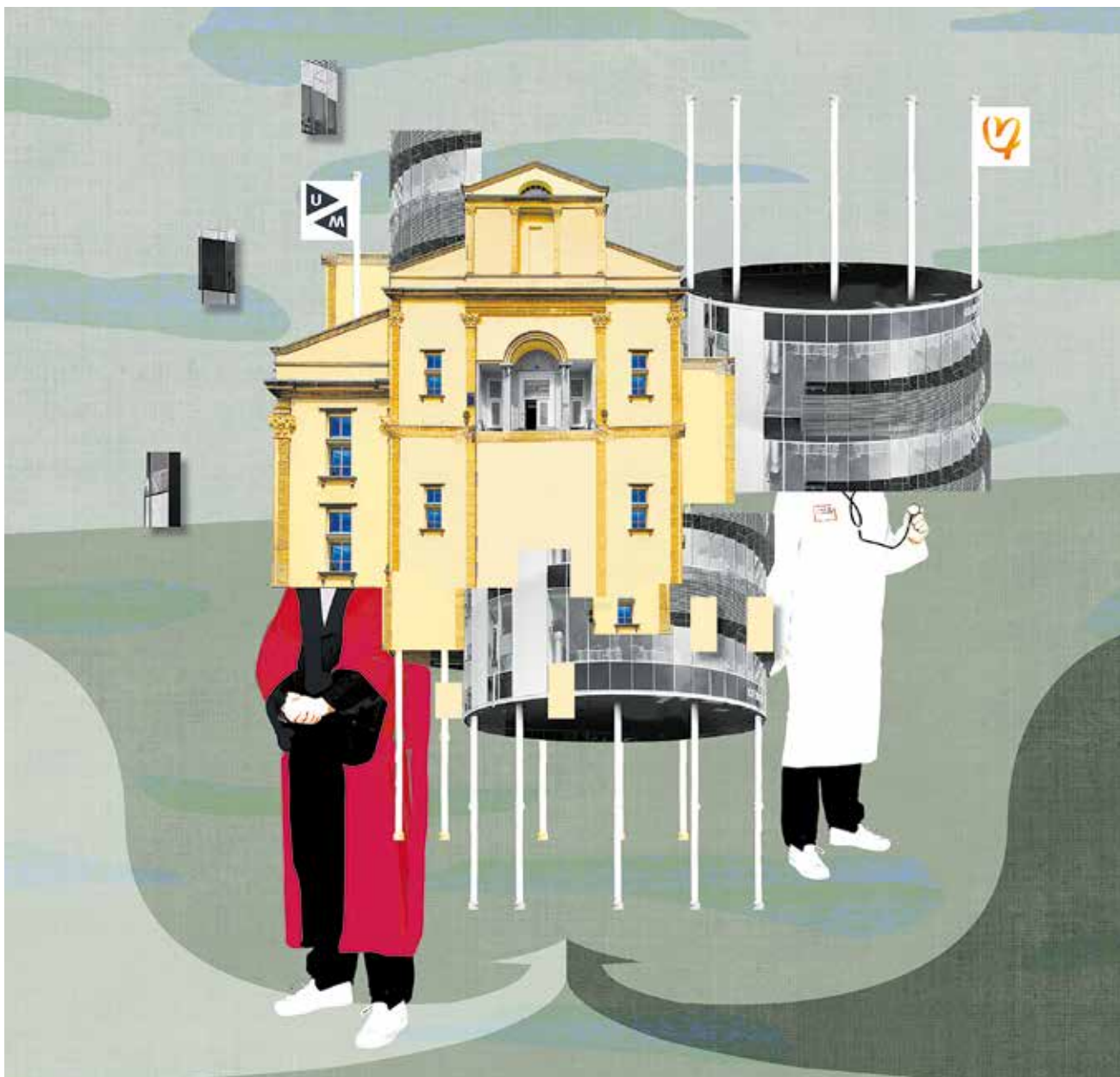
Collage: Simone Golob