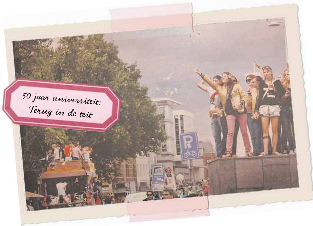
Studentenparade tijdens de INKOM in 2010. De 3 procent die dat jaar de beste studieresultaten behaalde, kreeg het collegegeld terug